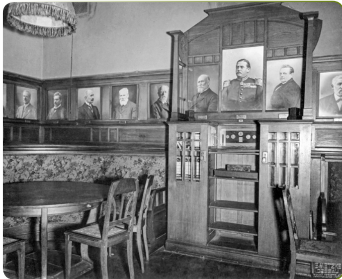
Bild unten: Dessau, Freimaurerloge, Esiko zum aufgehenden Licht, Innenansicht, Aufenthaltsraum vor dem Festsaal

Titelbild: Das Kriegerdenkmal am Kaiserplatz in Dessau. Es wurde im Mai 1935 abgebaut und am Bahnhof wieder aufgebaut.