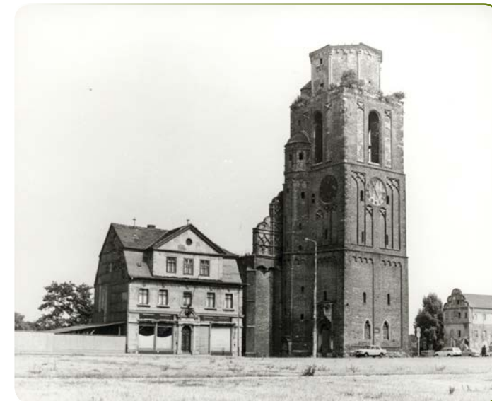
Bild unten: Dessau-Roßlau, Blick vom Zentralen Platz auf die Ruine der Schloßkirche (Marienkirche) und das Seelmannsche Haus. Aufnahme: 1970